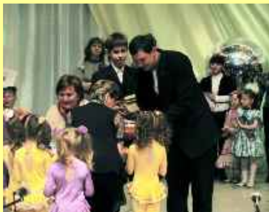
Festival artistique « Gouttes cristallines »