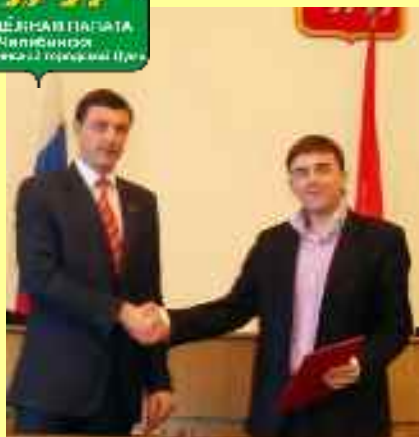
Chambre de jeunes auprès de l'Assemblée législative de la région de Tchéliabinsk