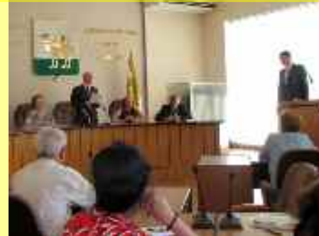
Participation à la plénière de l'organisation des vétérans de la ville