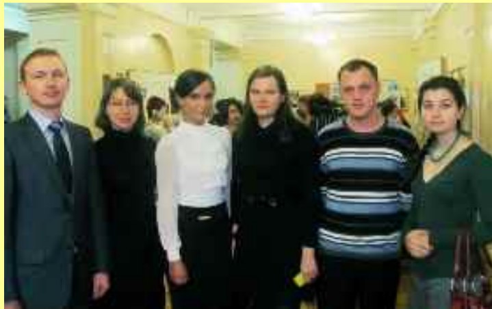
Forum socio-pédagogique « Partenariat socio- pédagogique dans l'éducation spirituelle et morale de la personnalité du citoyen » à l'université pédagogique de Tchéliabinsk