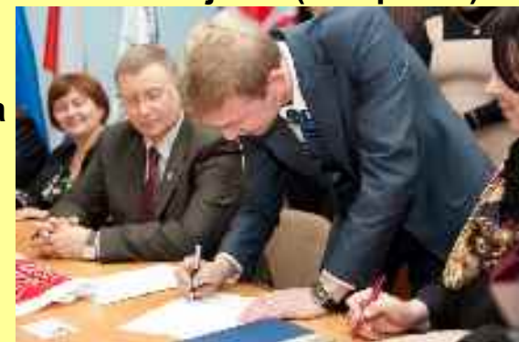
Programme national « Service de sang »

La chambre de jeunes est une réserve des cadres de la Douma de la ville