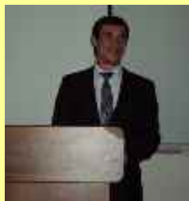
Décade de la science estudiantine