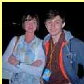
Forum international de jeunesse, Altaï