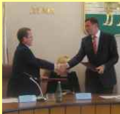
Commission électorale de jeunes de la région de Tchéliabinsk