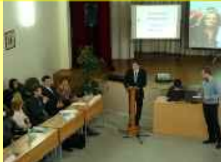
Conférence « Jeunesse active c'est l'avenir de la Russie »