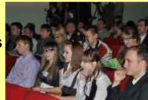
Conférence régionale sur l'entreprise des jeunes