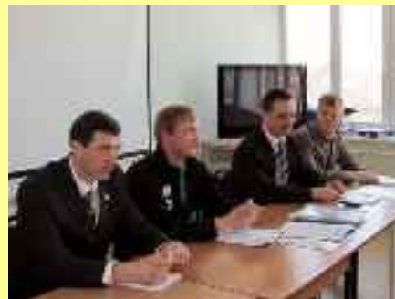
Championnat de la gestion de projet des écoles de Tchéliabinsk