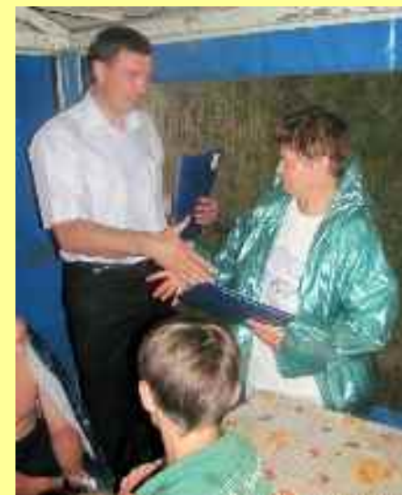
Fondation de la région de la protection des orphelins « Nadejda » (« Espoir »)