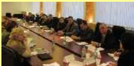
Table ronde sur les problèmes de l'enseignement