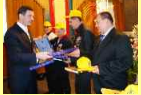
Avec les vétérans d'Afghanistan