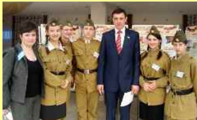
« Je suis citoyen de Russie ! »