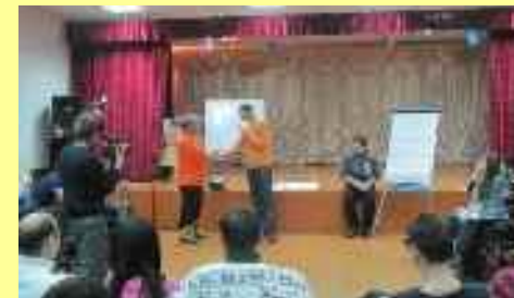
Festival des jeunes entrepreneurs