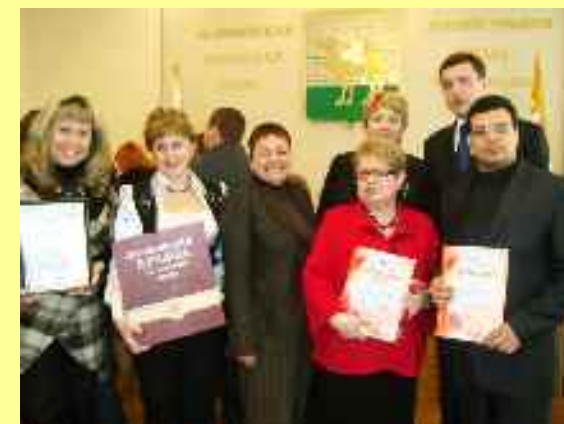
Festival de la chanson patriotique « Cœurs flammés »

La chambre de jeunes est une réserve des cadres de la Douma de la ville