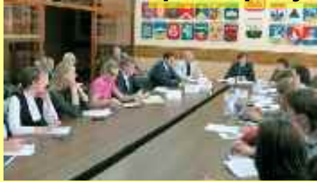
Table ronde sur le recensement

Les actions qu'on peut inscrire dans l'actif de la politique jeunesse :