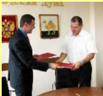
Fondation « Sotsgorod » (« Ville sociale ») de l'arrondissement Métallourguitcheski