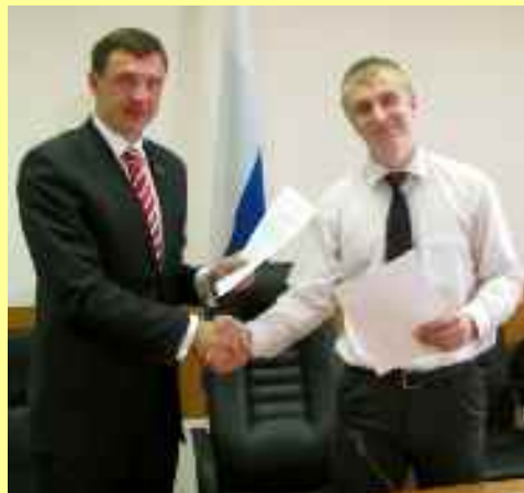
Chambre de jeunes auprès de la Douma de la ville de Ekatéroubourg