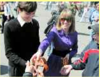
« Ruban de l'ordre de Saint-Georges »