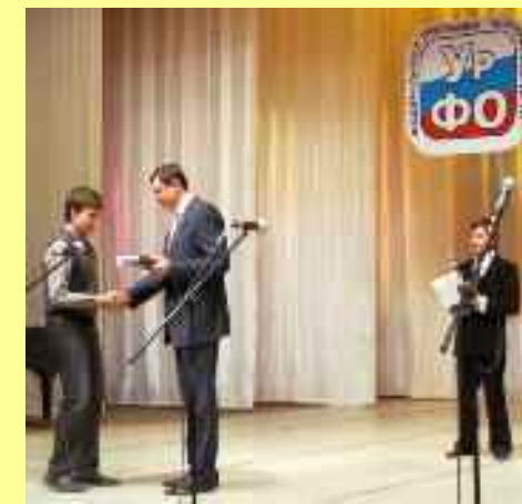
« Intellectuels du XXI e siècle »