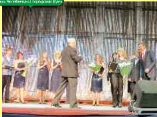
Festival « Printemps estudiantin »

Les membres de la Chambre ont souvent été des organisateurs, des participants aux jurys des concours à l'échelle municipale, régionale et nationale