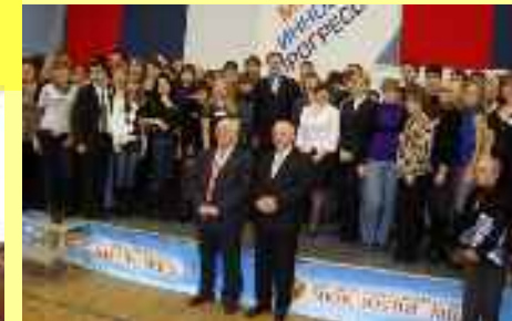
Forum national « Création et innovations des jeunes »