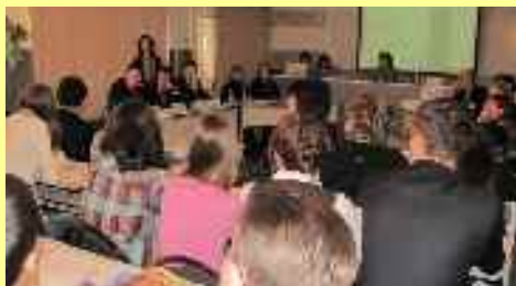
Discussion socio-politique « Jeunesse de la Russie »