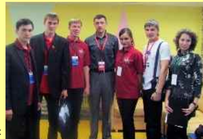
Forum de la jeunesse du district fédéral de l'Oural à Tioumen

Les membres de la Chambre ont participé aux forums : ACTIF-2010, SELIGUER-2010, ALTAÏ SIBERIE-2010