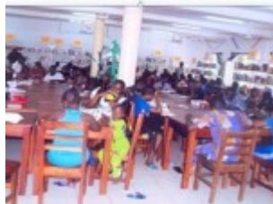
Insultation sur place dans la bibliothèque de Porto-Novo I