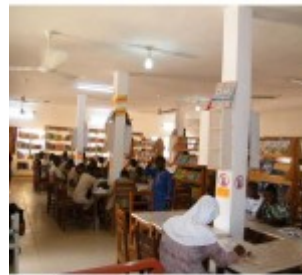
féte du CAEB à PARAKOU