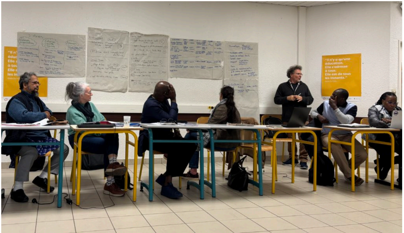
Photo : Productions des groupes de travail – Assemblée générale octobre 2024

Les membres du Conseil d'Administration remercient l'ensemble des membres de la Fédération et poursuivent les orientations prises lors de cette Assemblée. A l'avenir, la réflexion engagée autour des visas va également se poursuivre. Effectivement, des membres n'ont pas pu se rendre comme prévu à l'Assemblée générale, faute de visa, ce qui interpelle le réseau et impacte le déploiement des actions à l'international.