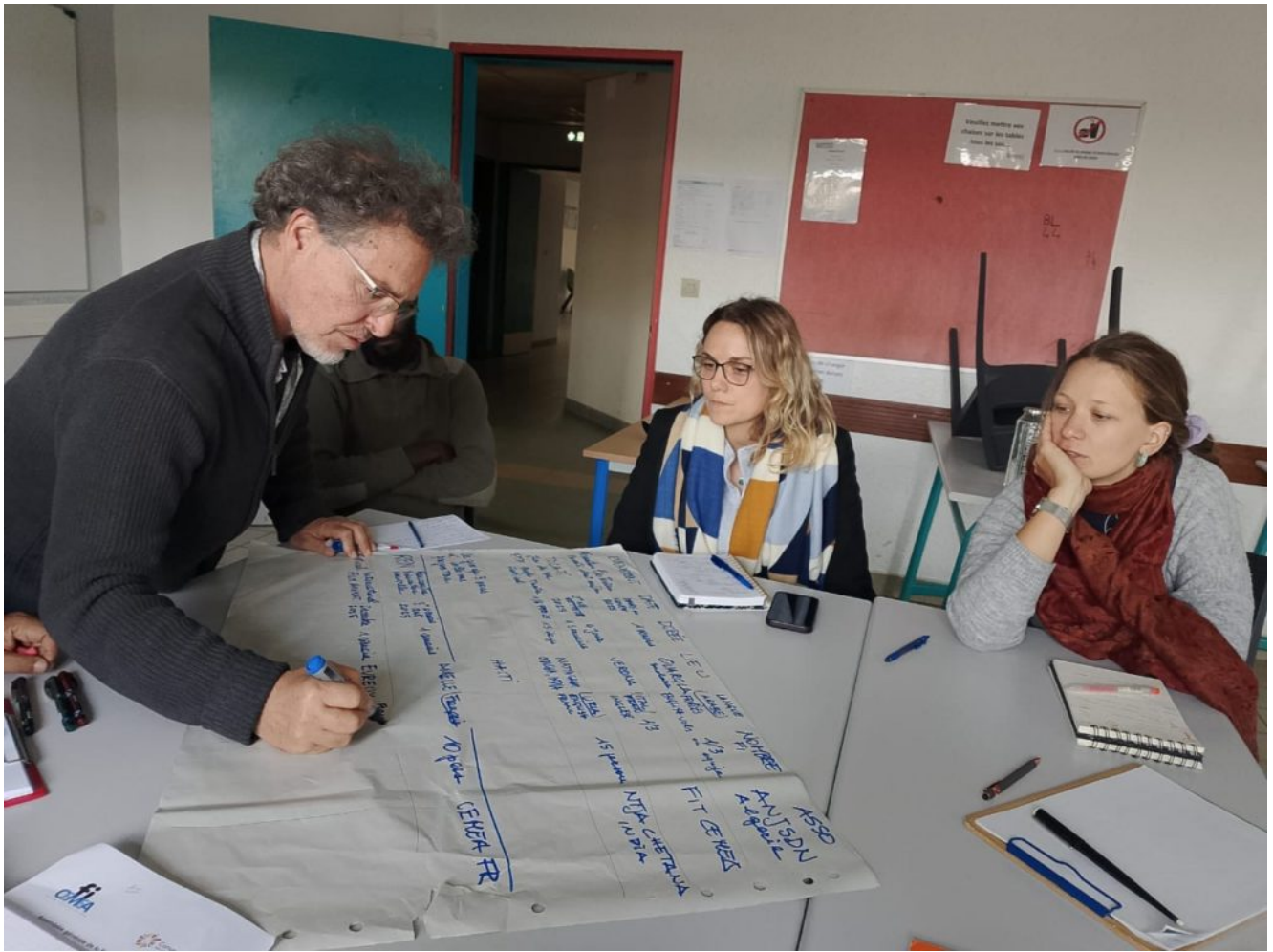
Photo d'un des groupes de travail – Assemblée générale octobre 2024