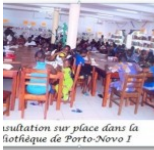
Insultation sur place dans la bibliothèque de Porto-Novo I