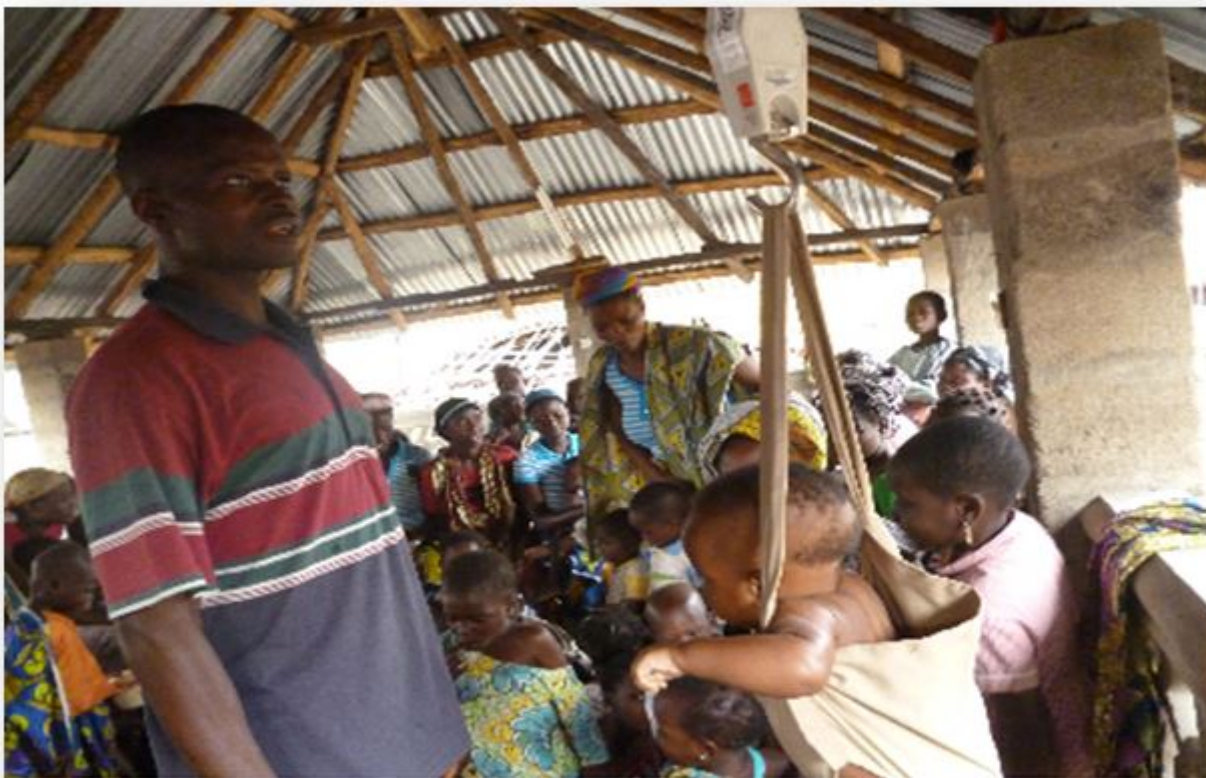
Séance de pesée: lecture de la balance par un membre de comité à Avagbodji