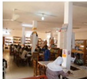
féte du CAEB à PARAKOU