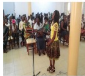
base finale du concours Spelling Bee organisé par le réseau de langues du CAEB