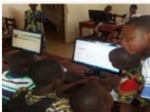
Les internautes en travaux d'exposé dans le cyber du CAEB