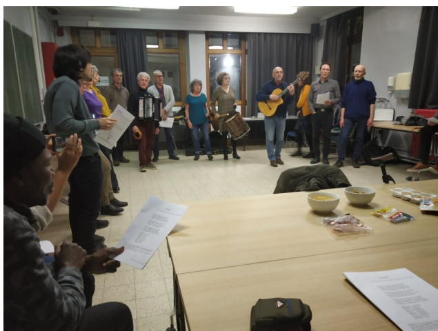
Groupe Vocal "C'est des Canailles !"

Les invitamos a seguir de cerca los proyectos de la FICEMEA, que está adquiriendo un nuevo aspecto, desarrollando tantos proyectos conjuntos hoy y está decidida a continuar mañana!