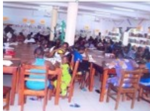
consultation sur place dans la bibliothèque de Porto-Novo I