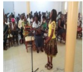
une finale du concours Spelling Bee organisé par le centre de langues du CAEB