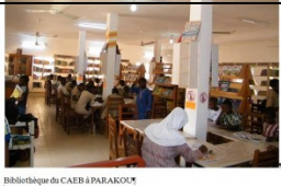
Bibliothèque du CAEB à PARAKOUM