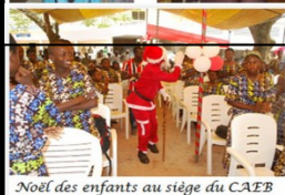
Noël des enfants au siège du CAEB