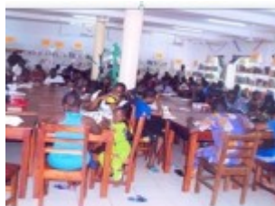
consultation sur place dans la bibliothèque de Porto-Novo I