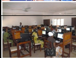
Cours assistés par ordinateurs dans la salle Ohama du laboratoire de langues du CAEB