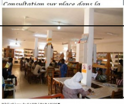
Bibliothèque du CAEB à PARAKOUM