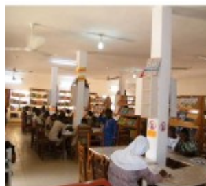
Bibliothèque du CAEB à PARAKOU