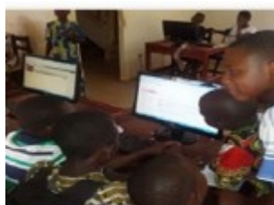
Les internautes en travaux d'exposé dans le cyber du CAEB