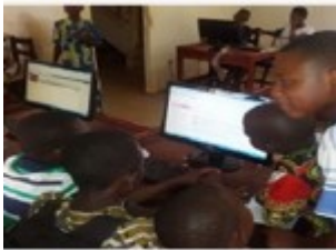
Les internautes en travaux d'exposé dans le cyber du CAEB