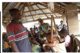
Séance de musique à l'école de la commune de...