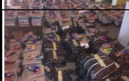
Distribution de kits scolaires aux boursiers du CAEB