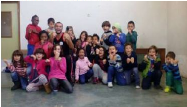
Clube Intercultural Europeu

L'expérience du CLUBE avec les CEMEA en matière d'approche de la Mobilité Professionnelle nous invite à ne plus penser les constructions organisationnelles et territoriales en termes de limites, fondées uniquement sur des liens de proximité identitaires tissés dans un espace continu, mais conçues en termes de situations, d'opportunités, de réseaux, de relations qui se dessinent en connexion entre des lieux distants. Et c'est dans ce sens que nous continuerons à travailler avec tout le réseau CEMEA afin que les mobilités soient de plus en plus apprenantes.