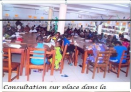
Consultation sur place dans la