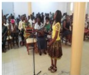
ase finale du concours Spalling Des préparés par le sestème de langues du CAEB 4