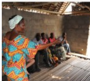
ntre des membres de comité. à Avagbod