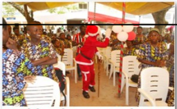
Noël des enfants au siège du CAEB