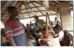
Remise de mandats financiers de la Fondation VALLET