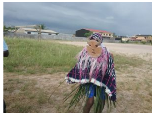
Masque Goly en Pays Baoulé