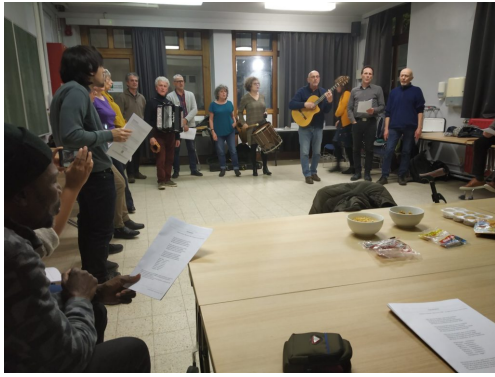
Groupe Vocal "C'est des Canailles !"