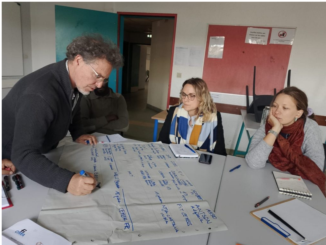
Photo d'un des groupes de travail – Assemblée générale octobre 2024

plaidoyers et de ressources pédagogiques.