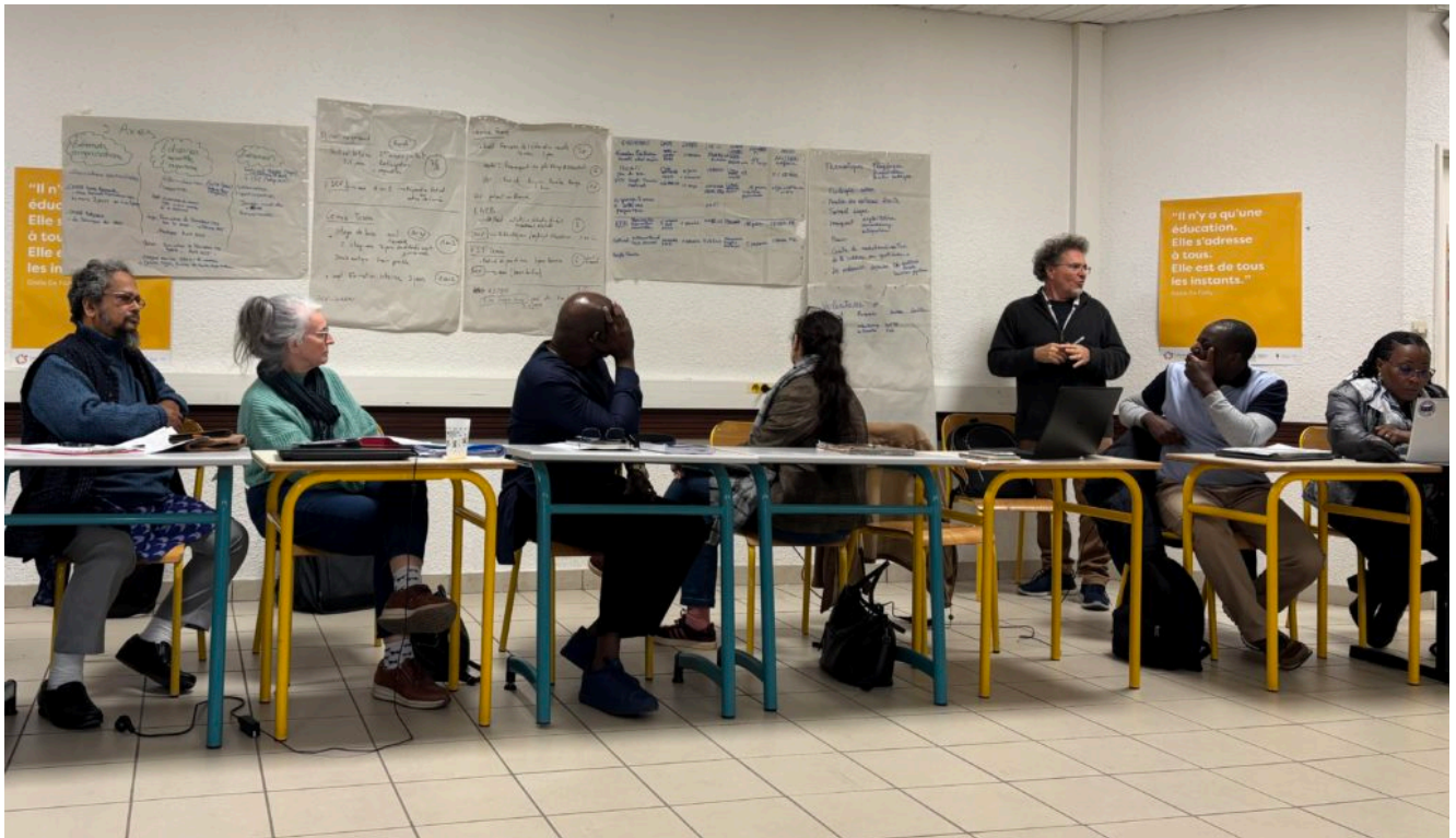
Photo : Productions des groupes de travail – Assemblée générale octobre 2024

Les membres du Conseil d'Administration remercient l'ensemble des membres de la Fédération et poursuivent les orientations prises lors de cette Assemblée. A l'avenir, la réflexion engagée autour des visas va également se poursuivre. Effectivement, des membres n'ont pas pu se rendre comme prévu à l'Assemblée générale, faute de visa, ce qui interpelle le réseau et impacte le déploiement des actions à l'international.