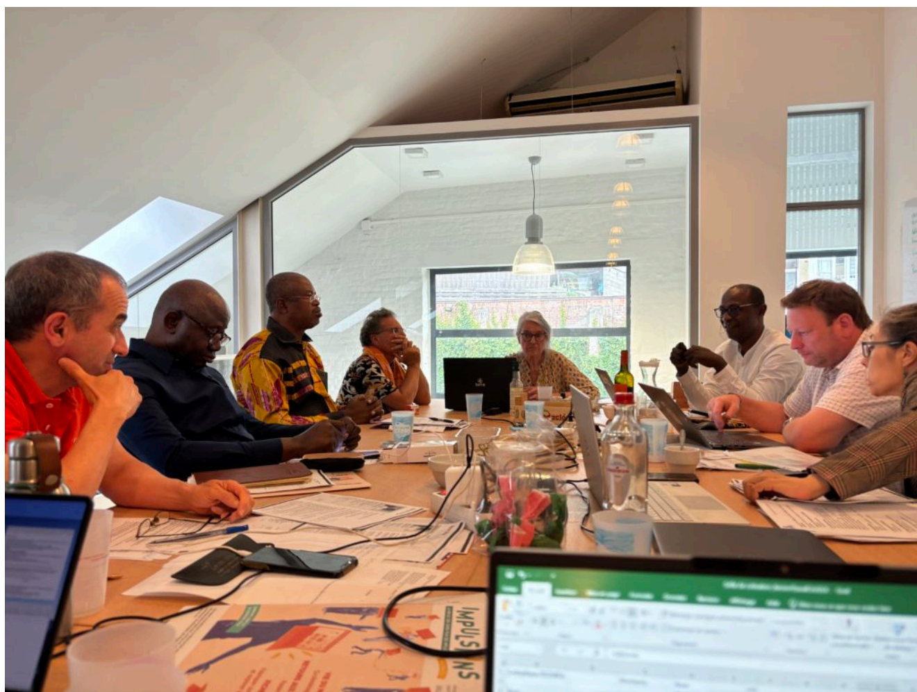
Photo du Conseil d'Administration – Séminaire de juillet 2024 à Bruxelles

Séminaire de 4 jours en juillet 2024 à Bruxelles, de nombreux dossiers étaient au travail et ont pu être présentés.