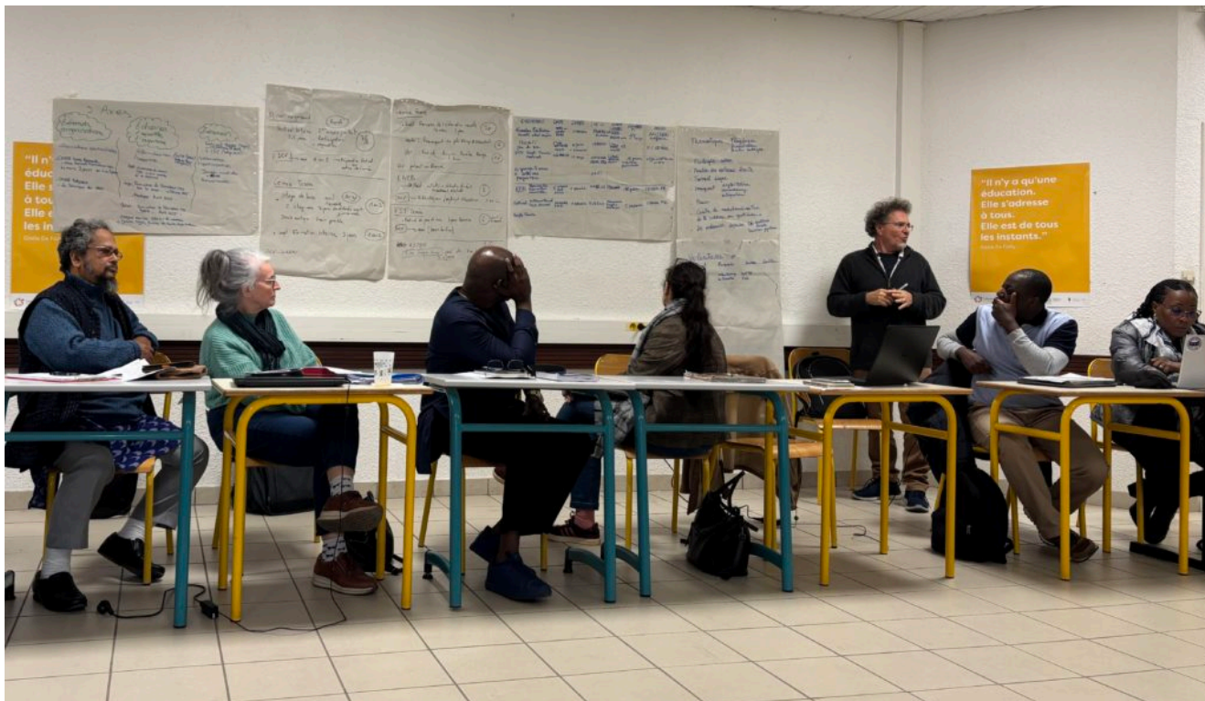
Photo : Productions des groupes de travail – Assemblée générale octobre 2024

Les membres du Conseil d'Administration remercient l'ensemble des membres de la Fédération et poursuivent les orientations prises lors de cette Assemblée. A l'avenir, la réflexion engagée autour des visas va également se poursuivre. Effectivement, des membres n'ont pas pu se rendre comme prévu à l'Assemblée générale, faute de visa, ce qui interpelle le réseau et impacte le déploiement des actions à l'international.